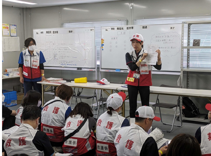
ミーティングの様子（県職員40名動員）