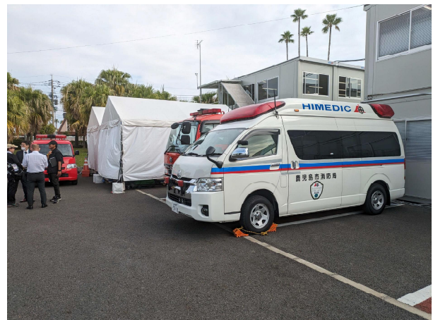
救護本部横に、救急車両配備