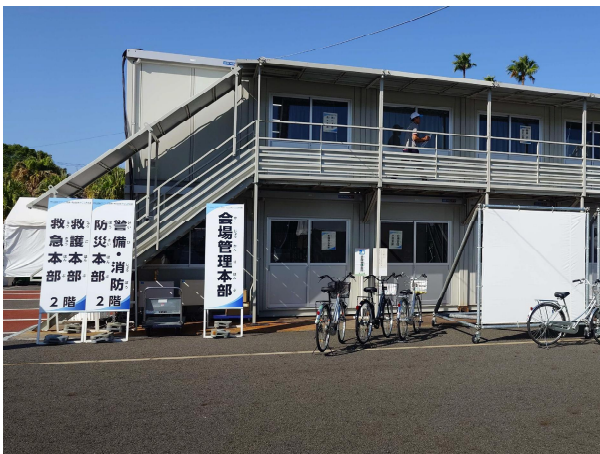
スタジアム外に救護本部設置